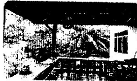
กิจกรรมบริหารแขนขาและ รอกบริหารแขนขา รพ.สต.หน้าถ้ำ

โครงการส่งเสริมสุขภาพผู้สูงอายุ (The Senior Health Promotion Project) มีวัตถุประสงค์เพื่อส่งเสริมสุขภาพผู้สูงอายุให้สามารถพึ่งพาตนเองได้ มีคุณภาพชีวิตที่ดี และมีความสุข โครงการนี้ดำเนินการโดยศูนย์ส่งเสริมสุขภาพผู้สูงอายุ โรงพยาบาลราชวิถี กรุงเทพมหานคร ปีงบประมาณ ๒๕๕๖